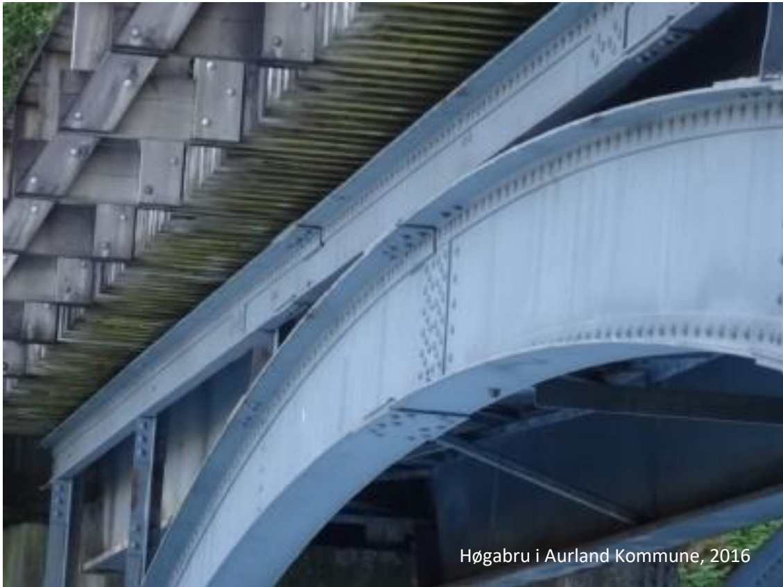
Høgabru i Aurland Kommune, 2016

I Norge har vi referanser til 3 stålbruer som har vært beskyttet med ZINGA i 25, 26 og 29 år, uten behov for vedlikehold. En av brune ble rehabilitert i 2014, etter 29 års eksponering over salt sjø. For 2 bruer er det etter 26 år fremdeles ikke planlagt rehabilitering.